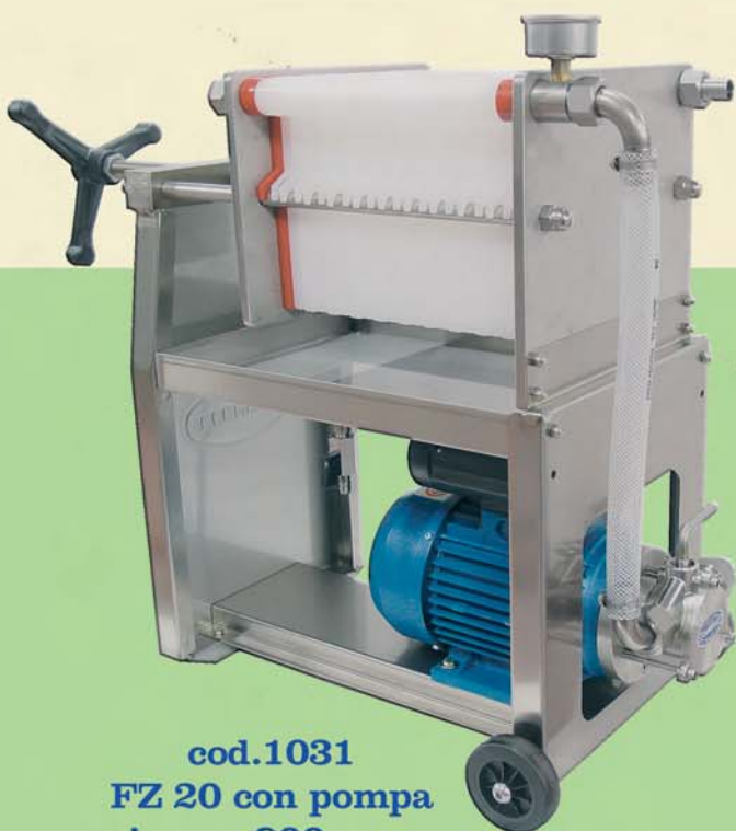
cod.1031 FZ 20 con pompa inox a 900 rpm

Caractéristiques: Construction en acier inox AISI 304. Plaques 20x20 en Moplen atoxique (sur demande en NORIL pouvant être stériliser à 120°C). Manomètre pour le contrôle de la pression. Vanne de réglage du débit.