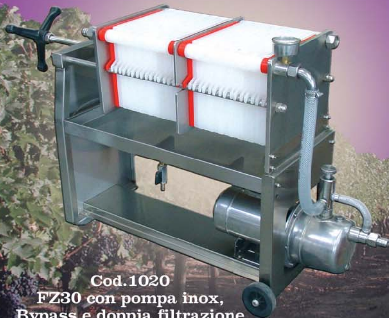
Cod.1020 FZ30 con pompa inox, Bypass e doppia filtrazione

Filtro en acero inox "FZ" : muy practico y seguro, que garantiza al pequeño productor un filtrado perfecto y seguro del vino: Según el tipo de capas filtradoras empleadas será posible lograr varios tipos de filtrado, consiguiéndose así: refinar; medio clarificar; clarificar; esterilizar; superesterilizar los vinos.