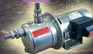
Pompa Tipo "E" 1-phase