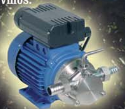
Pompa Tipo "Z" 3-ph / 1-ph